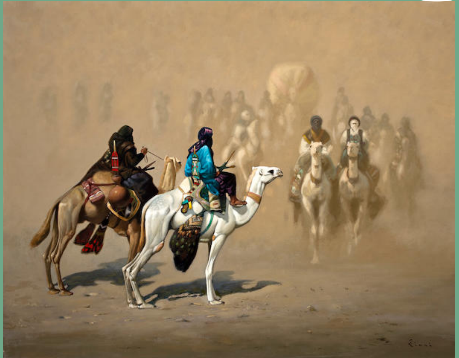
سائق الجمل في الصحراء