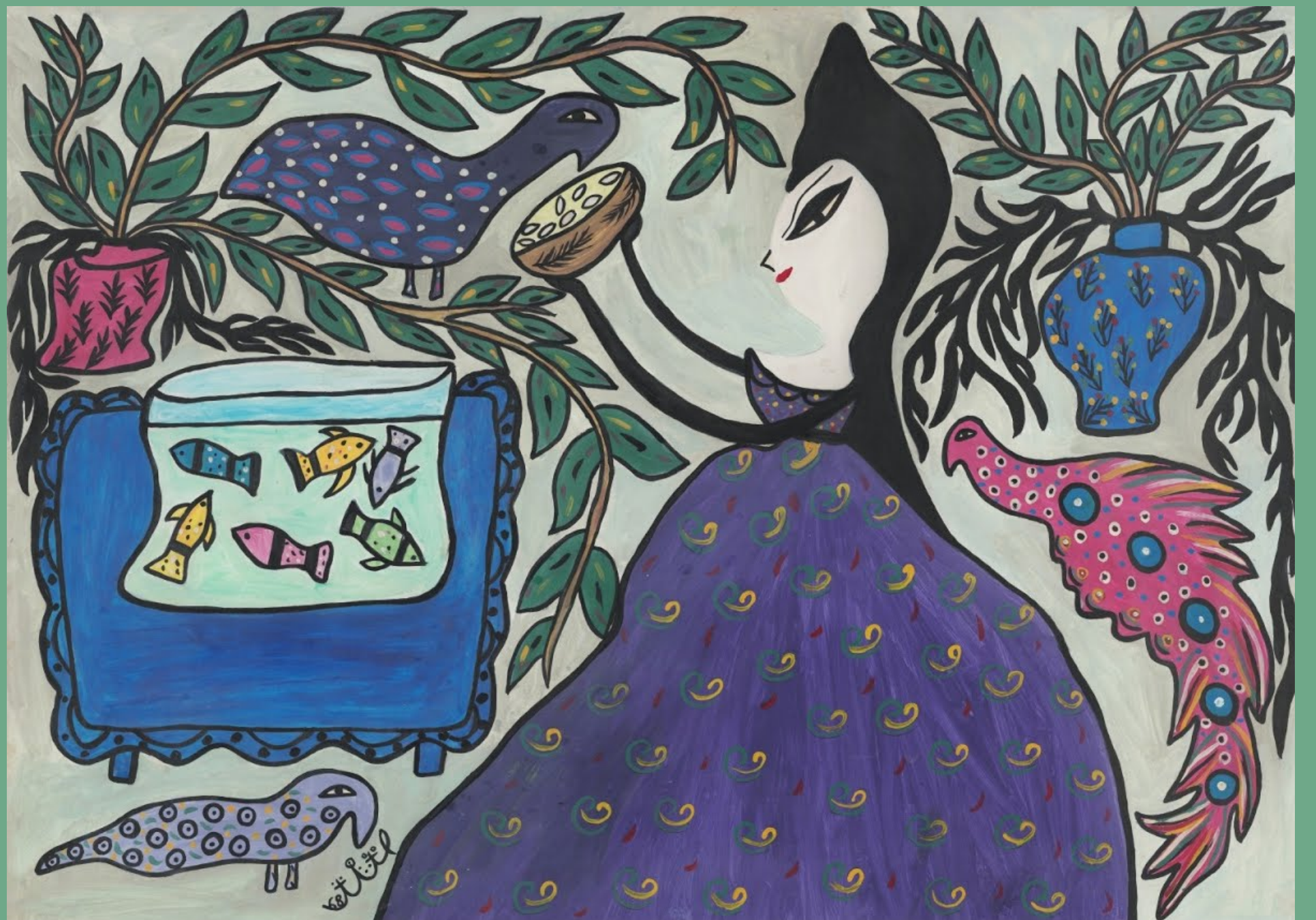
امرأة مع اثنين من الطاووس مع حوض السمك