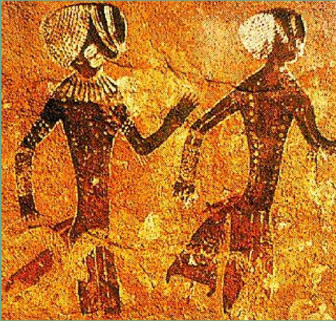
الفن الصخري المستدير