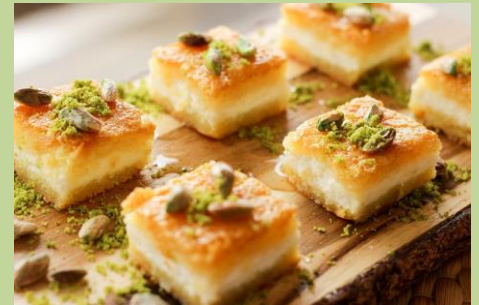
فول مدمس، عصير قصب السكر، و البسبوسة— Bean Stew, Sugarcane Juice, and Basbousa